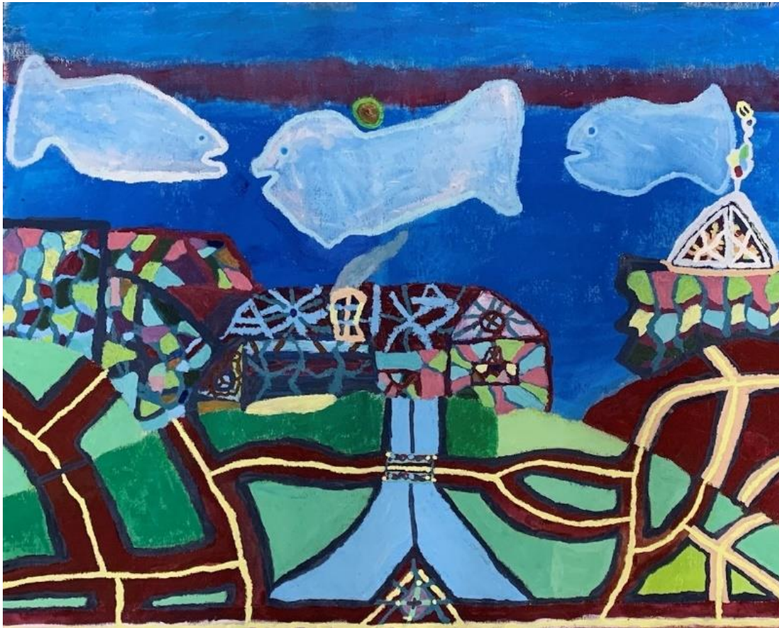
Monte de los cinco caminos, F.J.Sierra