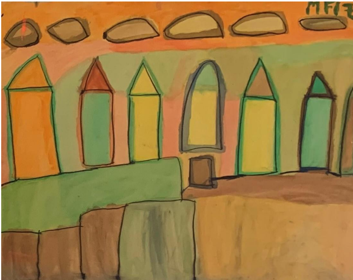
"Casas" acrílico sobre tabla 80 x100cm Manuel Fiz