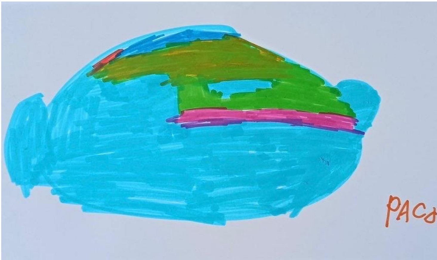
3. "Caras" obra sobre papel 30x 40cm de Paco Forte