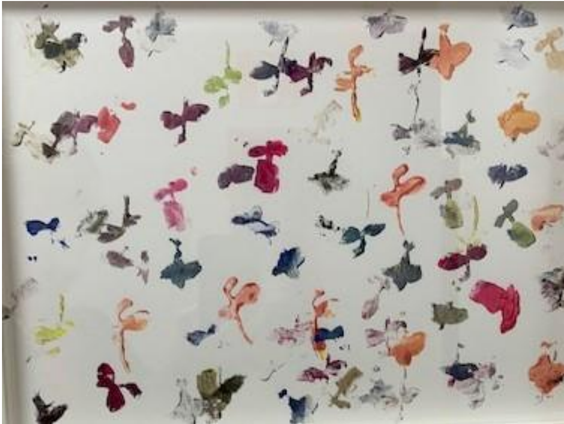
“Sin título” gouache sobre papel 30 x 40cm de Javier Segura.