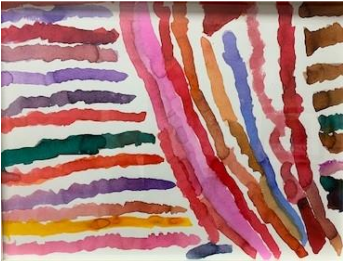
5. "Sin título", acuarela sobre papel 30 x 40cm Tomás Jiménez