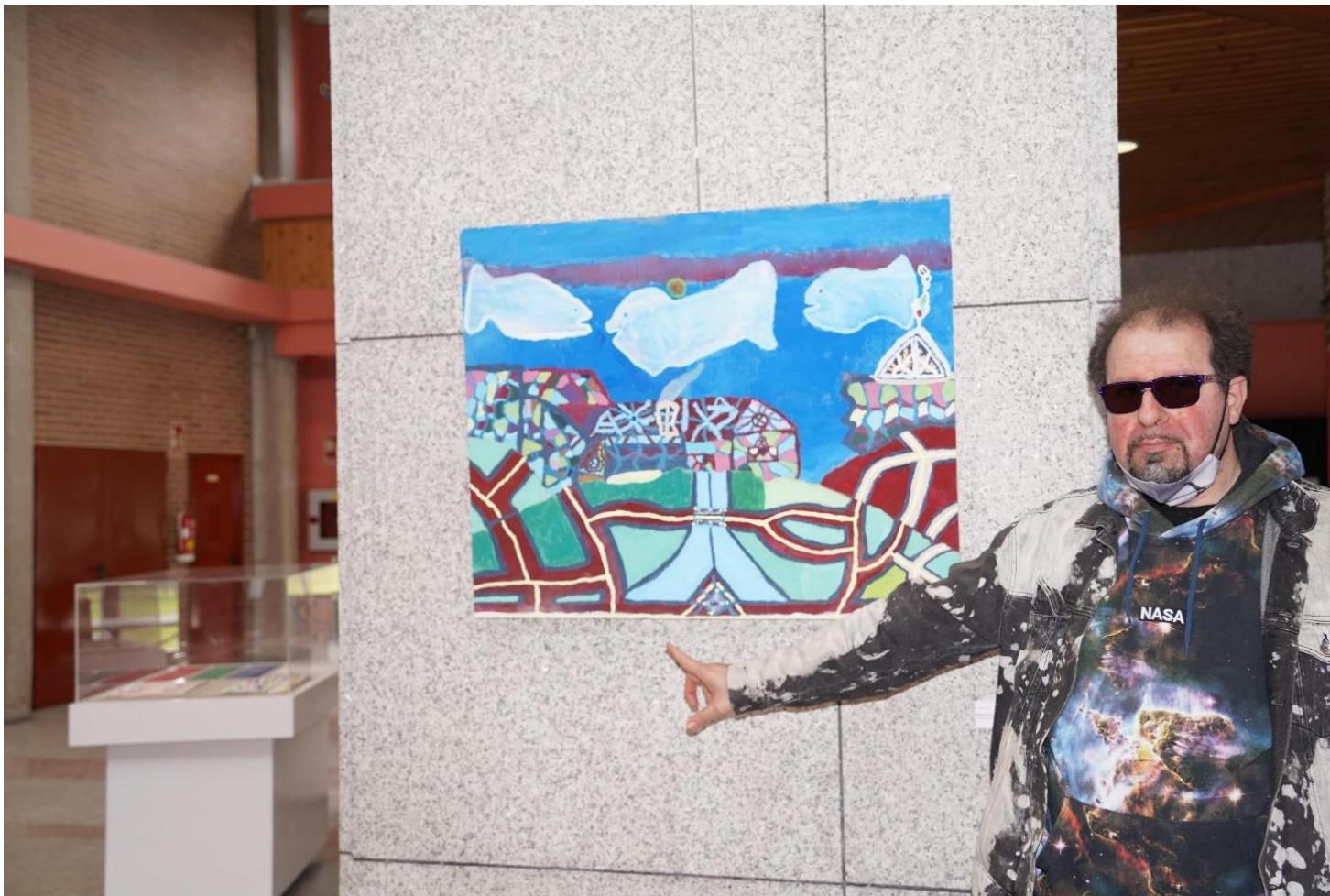
“monte de los cinco caminos”, acrílico sobre tela 73x 93cm retrato de F.J. Sierra.