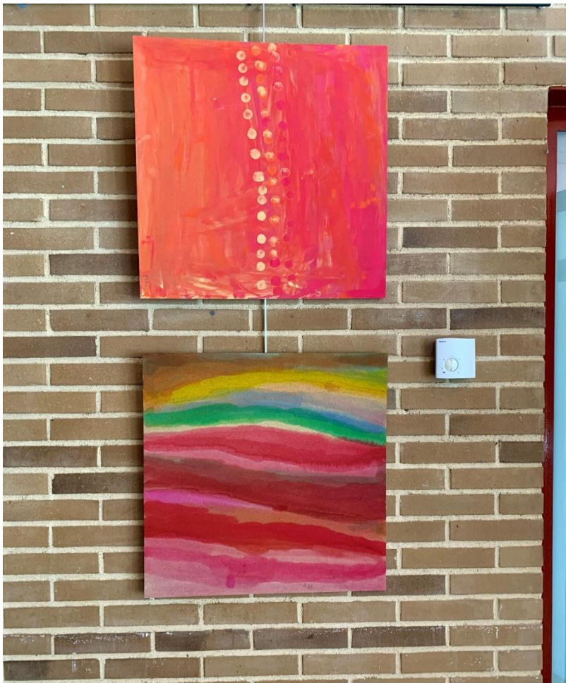
“Sin título”, gouache sobre tabla 40x 40cm Pilar Villacañas (arriba)