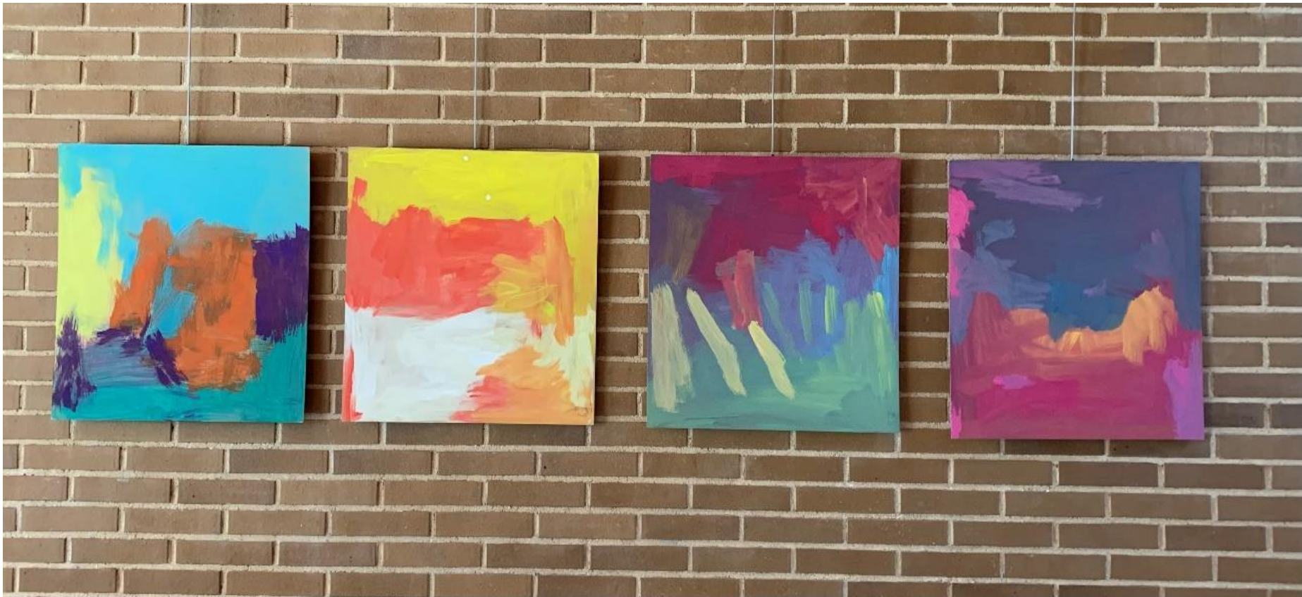
1,2,3,4, "Sin título", gouache sobre tabla Josefa Fernández