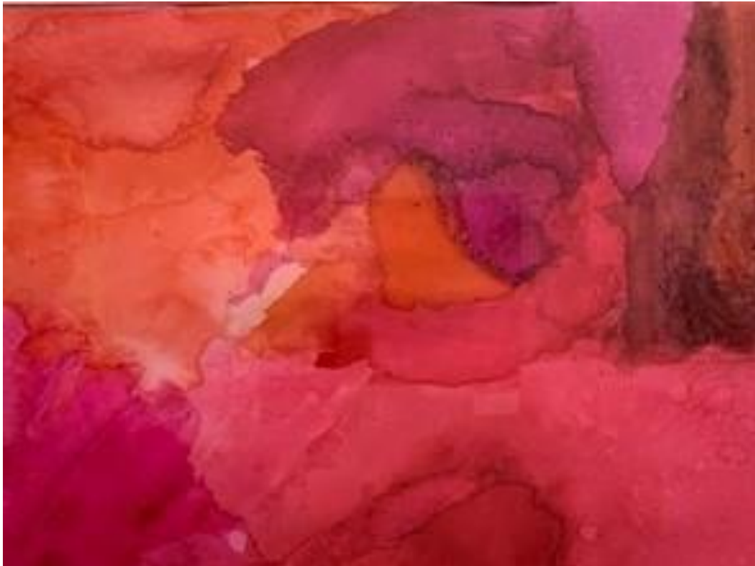
“Sin título”, acuarela sobre papel de Purificación Tejero.