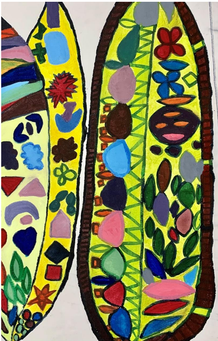
Hojas, acrílico sobre tela 55x 80cm Virginia Ruiz (detalle)