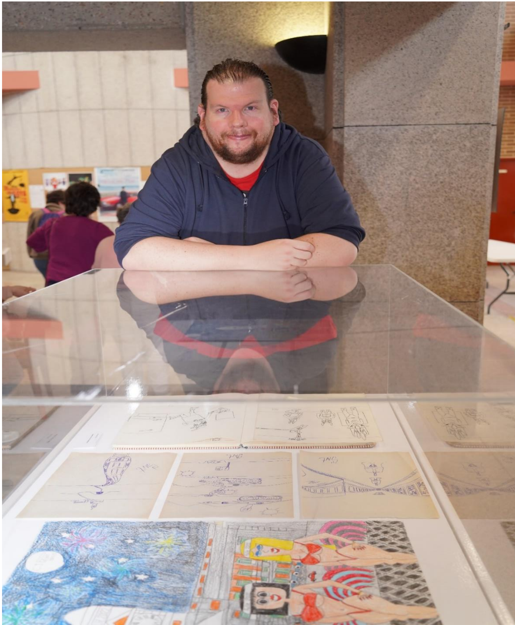
Comics de Santiago Morán