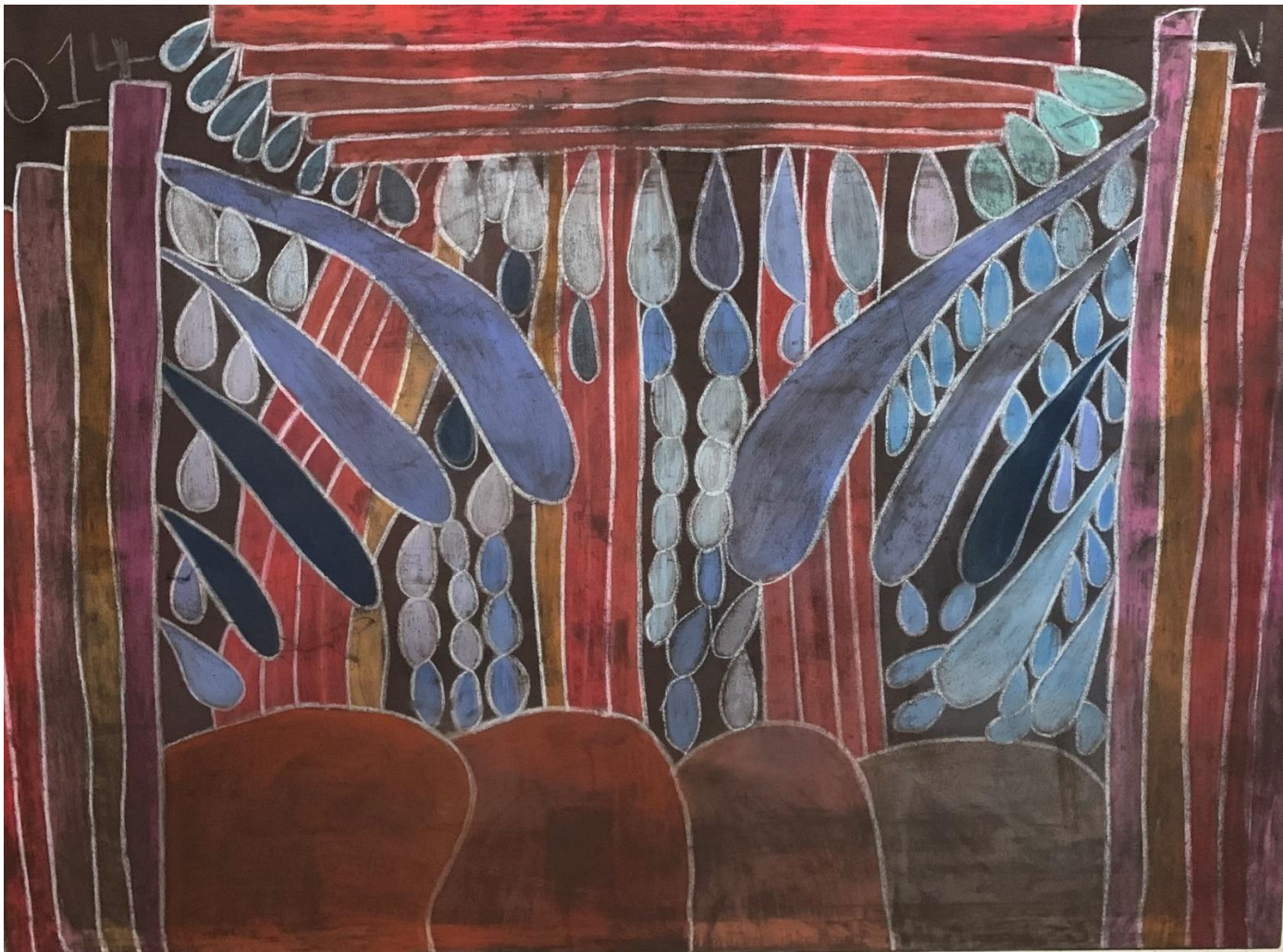
“Estalagmitas mágicas”, acrílico y pastel sobre tela. 164x 130cm Virginia Ruiz.