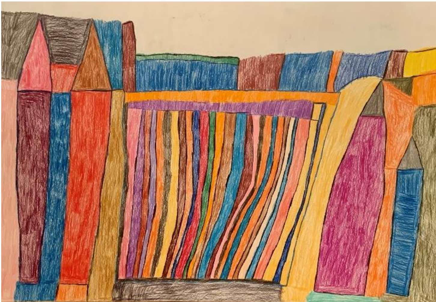
“Lápices”, obra sobre papel 50 x 70cm de Manuel Fiz