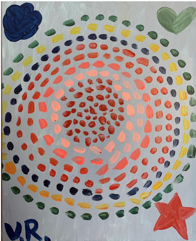
“Mandala”, acrílico sobre lienzo, 40x 45cm Virginia Ruiz