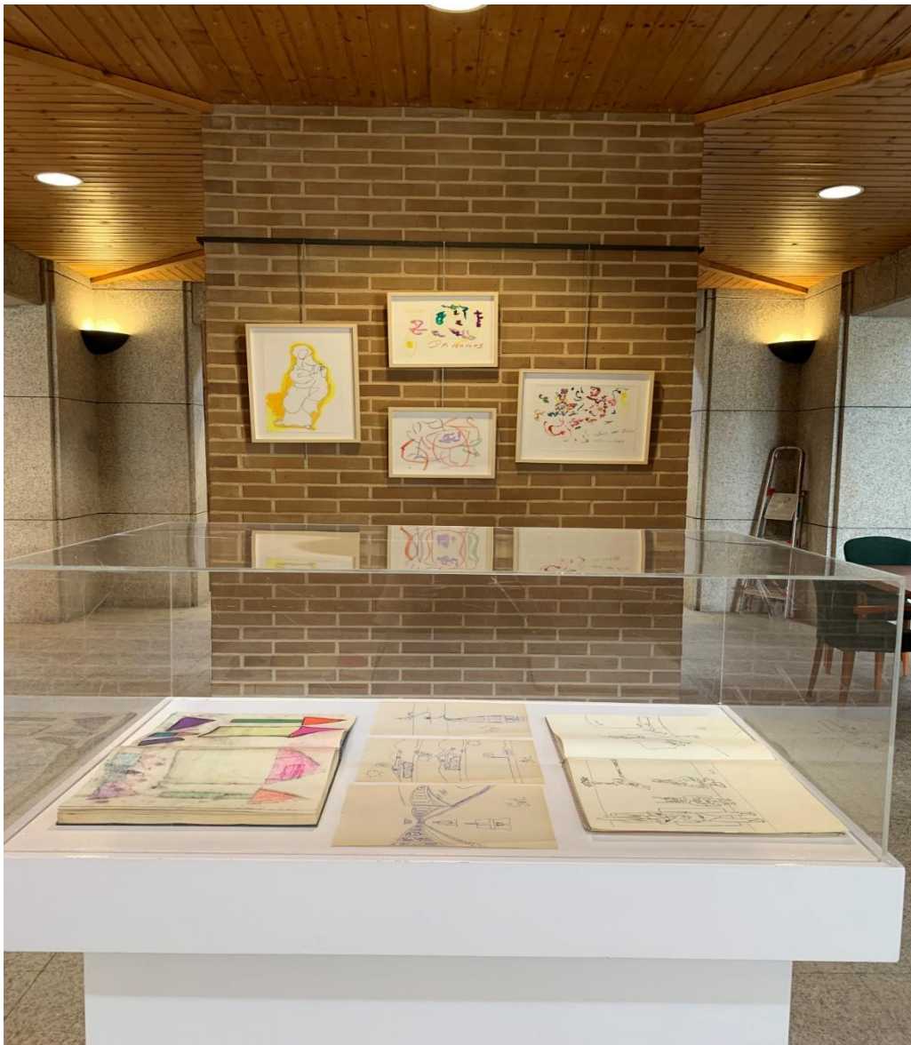
vista exposición obra sobre papel.