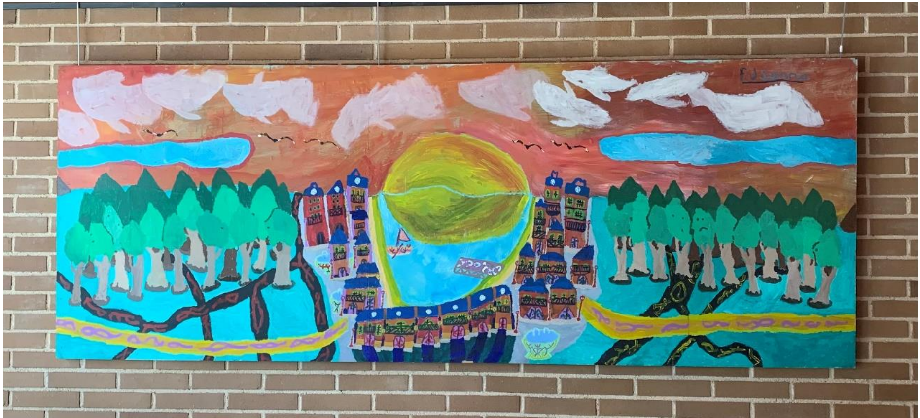
"Amanecer en ypeaches sprints", acrílico sobre tabla 269x100 Francisco Javier Sierra