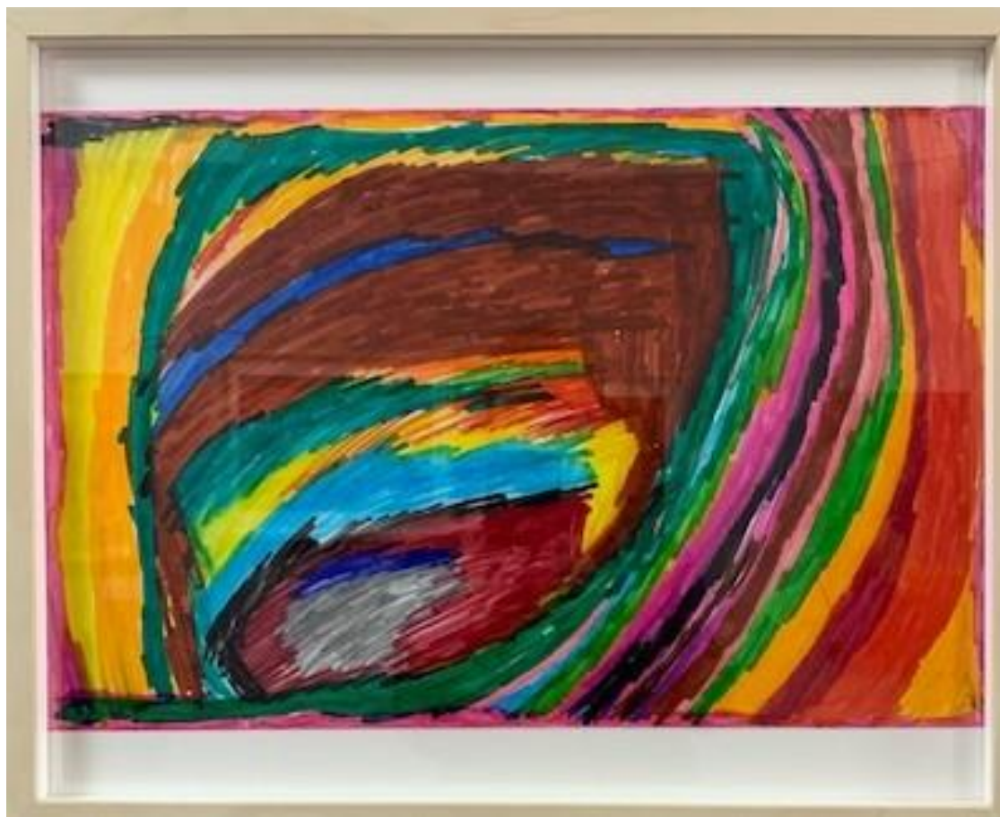
“Sin título” obra sobre papel 30x 40 cm y 40 x 50 cm Paco Forte