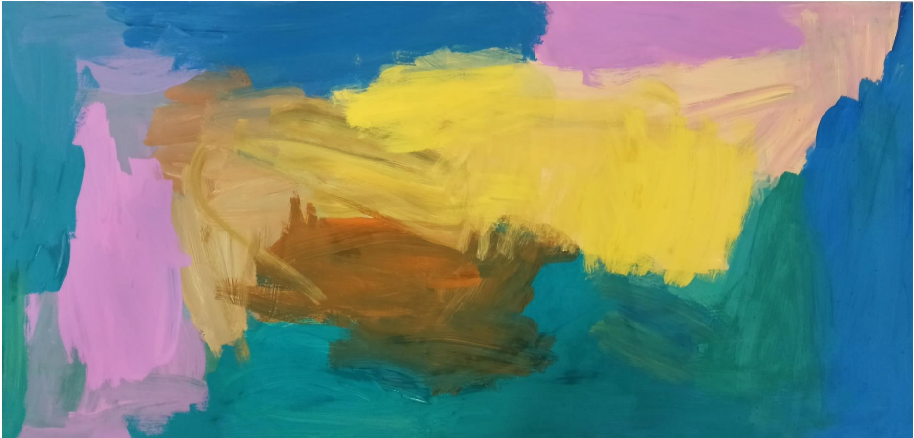
“Sin título” gouache sobre tabla de 60 x 122cm Josefa Fernández