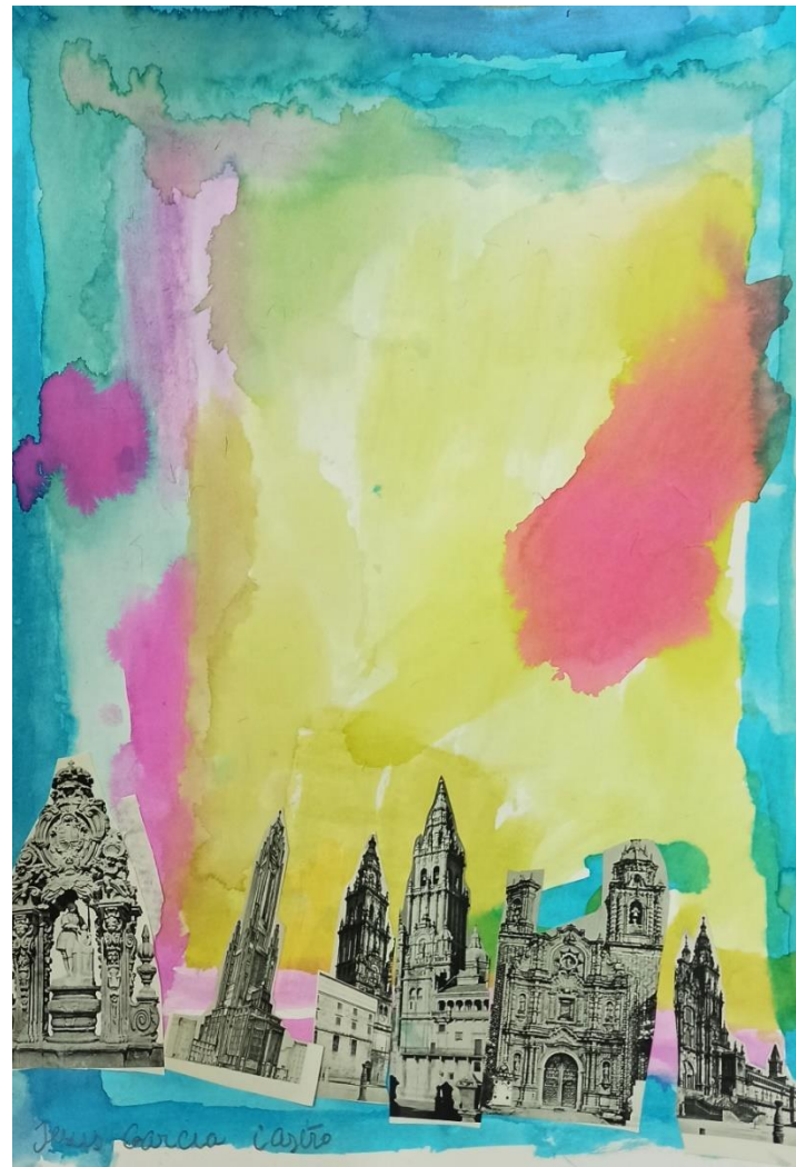
“ Sin título I y II “ collage sobre papel 30 x 40 cm Jesus García Castro