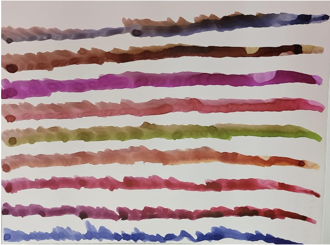
“Sin título” acuarela sobre papel de Tomás Jiménez