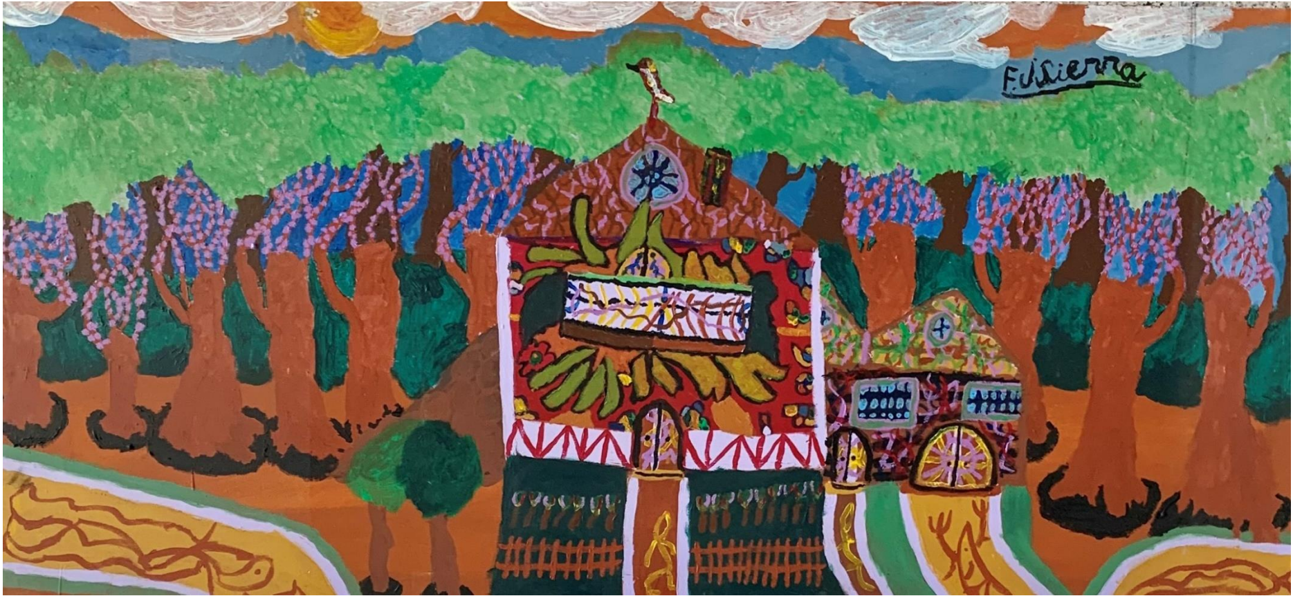
"Ciudadela" acrilico sobre lienzo 60x 112cm F.J. Sierra.